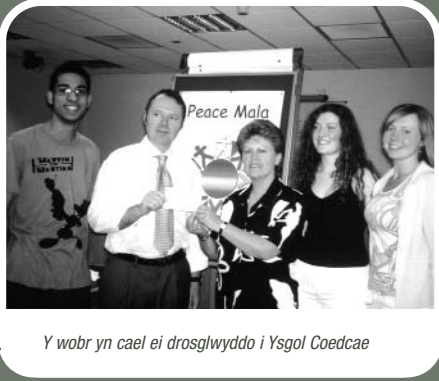
Y wobwr yn cael ei drosglwyddo i Ysgol Coedcae

Mae myfyrwyr yn Ysgol Coedcae yn dathlu wedi iddynt glywed mai y nhw yw enillwyr gwobr gyntaf Yn Union! 2003-04 , cystadleuaeth CEWC-Cymru i hyrwyddo hawliau dynol. Dyma'r drydedd wobwr a enillwyd gan brosiect Mala Heddwach yr ysgol yn Llanelli; mae'r prosiect yn defnyddio breichled symbolaidd i addysgu ynglŷn ag amrywiaeth crefyddol ac ethnig ac i frwydro yn erbyn rhagfarn. Enillwyd yr ail wobwr gan Ysgol Uwchradd Bedwas (Caerffili), a'r drydedd gan Ysgol Uwchradd Gwernyfed (Aberhonddu).