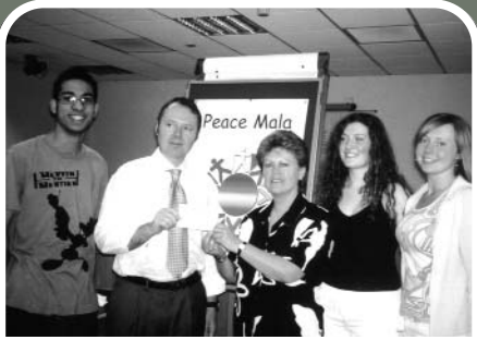
Coedcae School receives its prize

Students at Coedcae School are celebrating after they were named as first prize winners of Right On 2003-04 , CEWC-Cymru's competition to promote human rights. It is the third award for the Llanelli school's Peace Mala project, which uses a symbolic bracelet to educate about religious and ethnic diversity and to combat prejudice. Second prize was won by Bedwas High School (Caerphilly), while Gwernyfed High School (Brecon) took third prize.